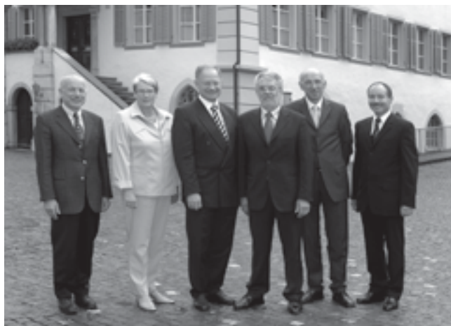
Der Regierungsrat im Amtsjahr 2005/2006

von Alpnach OW geboren am 16. Juni 1946 lic. rer. publ., Sarnen CVP im Amt seit 1973 Vorsteher der Staatskanzlei