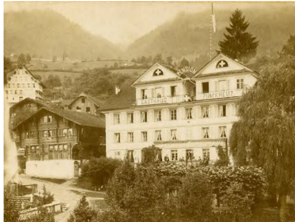
Abb. 2: Sachseln, Gasthaus zum Kreuz, ca. 1905 (P.0111.23.04).