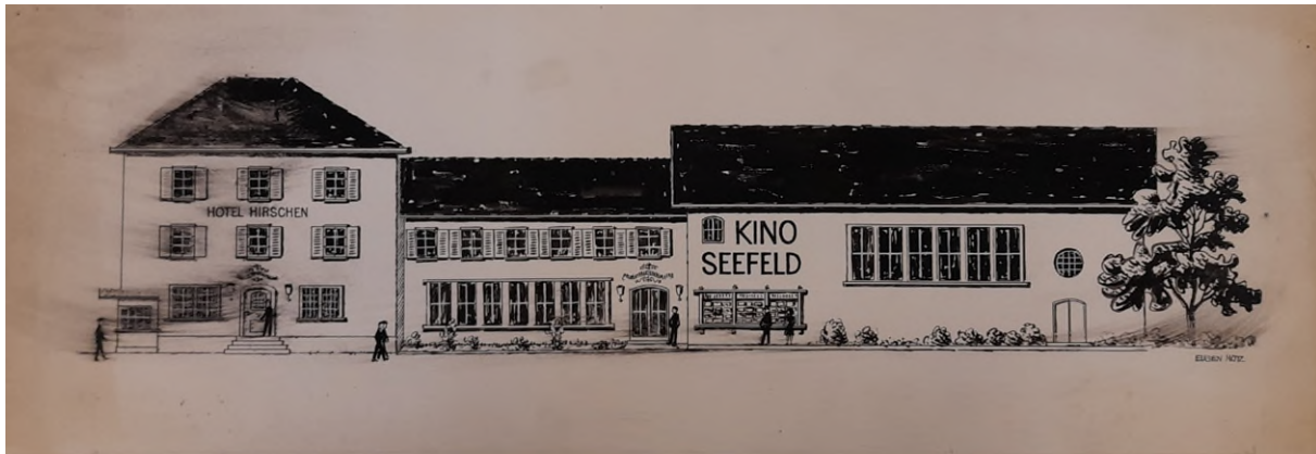
Abb. 2: Cliché des Kino Seefeld, um 1950 ( P.0163.09.17 )