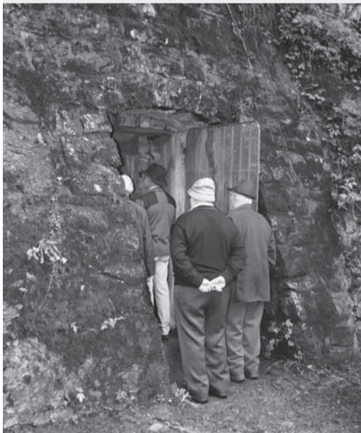
Für die Besichtigung des ehemaligen Divisions-Kommandopostens Altibach ist aus Platzgründen eine Anmeldung erforderlich.

Die Europäischen Tage des Denkmals finden dieses Jahr zum 18. Mal statt. Unter dem Motto «Im Untergrund» stehen für einmal Kulturgüter, die nicht direkt sichtbar sind, im Mittelpunkt. Die Denkmalpflege-Fachstellen der Kantone Obwalden und Nidwalden zeigen am Samstag, 10. September, militärische Baudenkmal, unterirdische Kraftwerksbauten und geben Einblicke in die spannende Welt der Unterwasserarchäologie. Die Denkmalpflege des Kantons Obwalden zeigt zum einen die Kraftwerkzentrale Unteraa ganz hinten in der Giswiler Aaried-Ebene, auch «Turbine Giswil» genannt. Auf einem geführten Rundgang durch den 1921 unterhalb des Lungensees erstellte Anlage kann die 90 x 16 x 12 m grosse Turbinenhalle besucht werden, die heute für Kunstveranstaltungen genutzt wird. Die Generatoren liegen seit 1994 in einem dahinter liegenden Bergstollen, der am Denkmaltag exklusiv besichtigt werden kann. Vom Kommandoposten zum Käsekeller, so lässt sich die Baugeschichte des zweiten