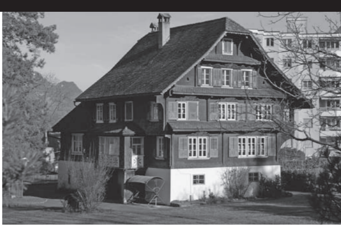
Das Jollerhaus, bevor es abgebrochen wurde.