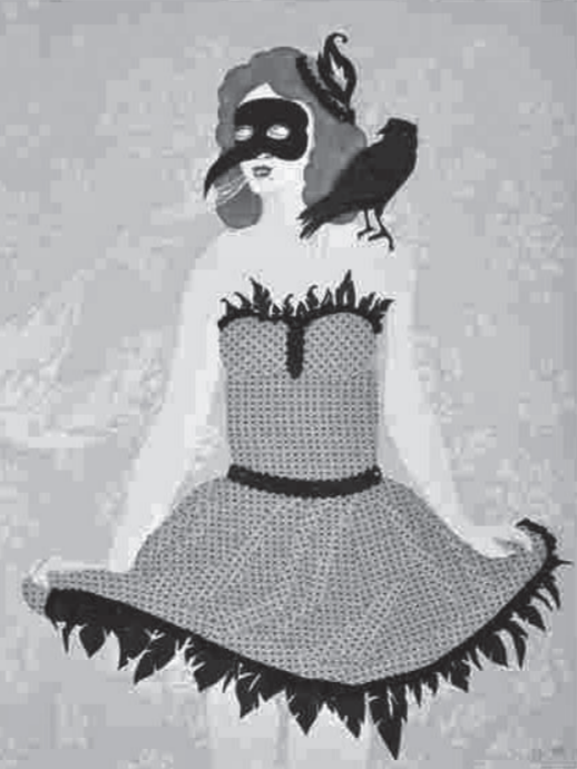
Ein Werk der Textilkünstlerin Corinne Odermatt an der NOW09.

Einmal pro Jahr macht sich die Kantonale Kulturförderungskommission auf den Weg in andere Orte der Kunst und Kultur. Die Reisen – sie werden privat finanziert – führten die Kommissionsmitglieder in den letzten Jahren ins Tessin, ins Elsass, in den Vorarlberg, ins Wallis, nach St. Gallen oder nach Glarus. Die Reisen dienen sowohl der Weiterbildung als auch der Pflege des Austausches.