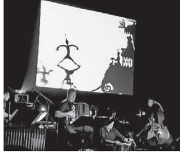
Renaud Garcia Fons an den SMT.

Wir sind gespannt auf die 18. Ausgabe der SMT, die vom 16. bis 21. April 2012 stattfinden werden.