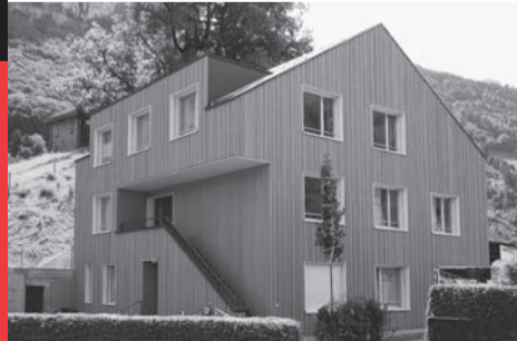
Das Haus am Hubel wird am 12. November 2011 besucht.

Heimatschutz Sektion Nidwalden und dem Architekturforum Uri übernommen, mit dem Ziel, diese spannende Aktion im Lebensraum Nidwalden und Uri weiterzuführen. Infolge der gemeinsamen Durchführung mit Uri wird ebenso der Kontakt zwischen den Nachbarkantonen gefördert. Die Markierung ist keine Auszeichnung und keine Preisverleihung, sondern verfolgt das Ziel, in der heutigen Zeit unserem Lebensraum Beachtung zu schenken. Dabei sollen verschiedene Themenkreise wie alltägliches Bauen, Bauen ausserhalb der Bauzonen, Aussenräume oder Landschaftsgestaltungen zur Sprache kommen.