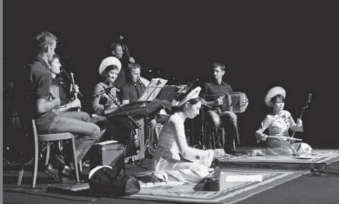
Die Alpnacher Formation «Siidhang» im Zusammenspiel mit den Musikerinnen aus Vietnam am OBWALD 2011.

sehr hoher Qualität waren, gepaart mit der einmaligen Atmosphäre machten OBWALD 2011 einmal mehr zu einem Kulturereignis, das emotional berührt und Besucher und Medien gleichermaßen zum Schwärmen bringt.