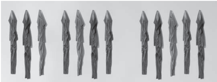
Die Fellkleider, Kunstwerke des Bildhauers Rochus Lussi.

Die Ausstellung im Freibad Marzili beginnt am 16. Oktober und dauert bis zum 19. November 2011 und ist täglich zugänglich.