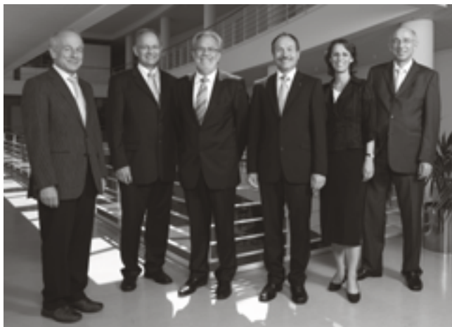
Der Regierungsrat im Amtsjahr 2008/2009

von Alpnach OW geboren am 16. Juni 1946 lic. rer. publ., Sarnen CVP im Amt seit 1973 Vorsteher der Staatskanzlei